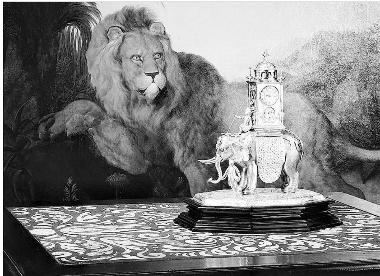
Am Sonntag ist eine Führung durch die Kunst- und Wunderkammer der Burg Trausnitz.

Am Sonntag um 14 Uhr heißt es „Krokodil und Pflaumenkern, Astrolab und Fürstenbild – Zu Besuch in der Kunst- und Wunderkammer“ der Burg Trausnitz. Anhand herausragender Kunstwerke der Renaissance spiegelt die „Kunst- und Wunderkammer“ das Wesen der Kunstkammer im Allgemeinen, aber auch den speziellen Charakter der einstigen Wittelsbacher Sammlungen wider. Zugleich wird dem Besucher die Prachtentfaltung des höfischen Lebens unter Erbprinz Wilhelm vor Augen geführt, der Künstler aus ganz Europa um sich scharte. Der Eintritt kostet fünf Euro für Erwachsene, Kinder sind frei. Eine Anmeldung ist erforderlich unter Telefon 9241115.