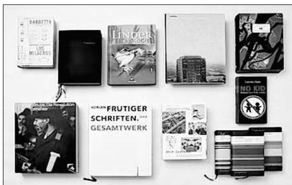
„Die schönsten deutschen Bücher“ sind in der Stadtbücherei im Salzstadel zu sehen.

Die Stadtbücherei im Salzstadel zeigt die Bücherausstellung: „Die schönsten deutschen Bücher 2009: vorbildlich gestaltet in Satz, Druck, Bild und Einband“.